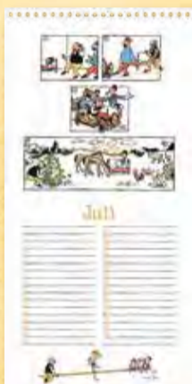
Der erste Ferientag, Berliner Illustrirte Zeitung 25/1936