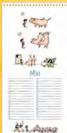
Die Geburtstagsüberraschung, Berliner Illustrirte Zeitung 26/1935