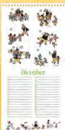
Geburtstagsfeier, Ullstein-Band I, S. 1/1935