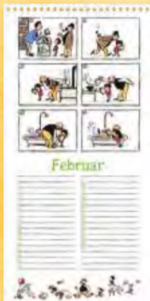
Das fesselnde Buch, Berliner Illustrirte Zeitung 43/1936