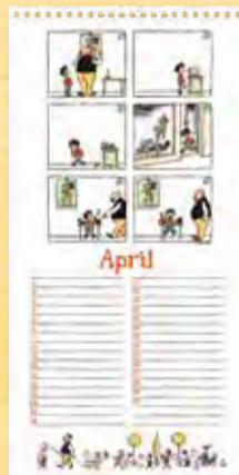
Die Ostereier bringt der Osterhase, Berliner Illustrirte Zeitung 16/1935