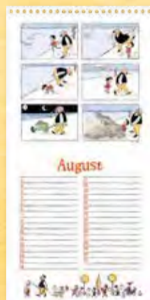
Spiel am Strande (Der Gute), Berliner Illustrirte Zeitung 27/1935