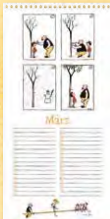
Ein Jahr später, Berliner Illustrirte Zeitung 23/1935