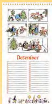
Liebe Gäste zum Feste, Berliner Illustrirte Zeitung 52/1936