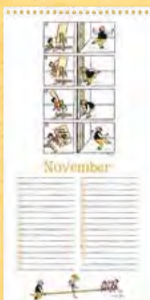
Heimlichkeiten vor dem Fest, Berliner Illustrirte Zeitung 51/1936