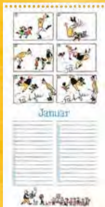
Mit Witz Bescheid geritzt, Berliner Illustrirte Zeitung 5/1936

Vater und Sohn: Wer kennt sie nicht, diese liebenswerten Bildgeschichten des genialen Zeichners Erich Ohser alias e.o.plauen, die seit Jahrzehnten die Menschen begeistern? Sparsam im Strich und pointiert in der Aussage erzählen die Geschichten von kleinen Pannen und witzigen Begebenheiten, die der gutmütige Vater und sein pfiffiger Sohn in ihrem Alltag erleben. Der vorliegende Geburtstagskalender enthält zwölf der schönsten Vater-und-Sohn-Geschichten rund um das Jahr. Behutsam koloriert entsprechen sie der Intention von Erich Ohser, der zu Geburtstagen gerne selbst Vater-und-Sohn-Glückwünsche in Farbe verschickte.