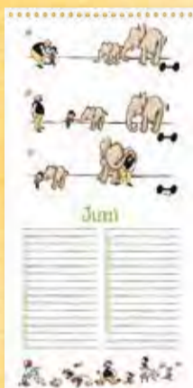
Dank der Dickhäuter, Berliner Illustrirte Zeitung 30/1935